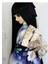
立て矢金更紗SD・13SD・ DD共通サイズob-0188