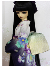
お文庫虹SD・13SD・DD共通サイズob-0190