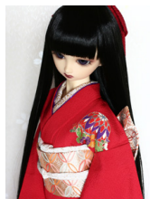
振袖手鞠と蝶々SD・13SD D・DD共通サイズk-0253