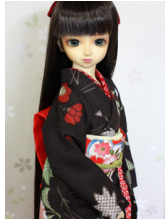
小振袖吹き寄せSD・13SD・DD共通k-0339