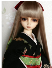
小振袖牡丹(単衣仕立て)SD・ 13SD・DD共通サイ ズk-0176