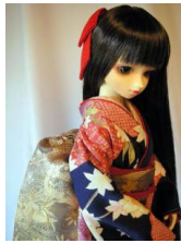
だらし帯 鳳凰SD、13SD、DD共通サイズob-0049