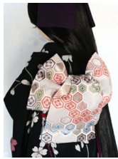
ふくら雀亀甲SD・13SD・DD共通サイズob-0150