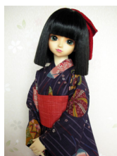
浴衣セット 手まり (単衣仕立て) 13SD、DD共通サイズk-0122