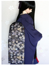
だらり帯桜流水SD・13SD D・DD共通サイズob-0158