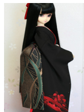
だらり帯黒地熨斗SD~16-SD・DD共通ob-0250