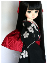
お文庫赤の立湧MSDサイズ mob-0045