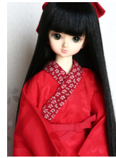
小振袖用長襦袢紅色に金彩M SDサイズmn-0015