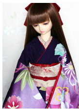
裾引き振袖紫ぼかしに八重桜 SD・13SD・DD共通サ イズk-0269