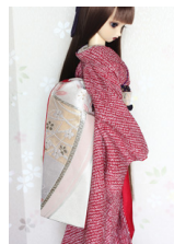
だらし帯銀櫻 2SD・13SD SD・DD共通サイズ ob-0146b