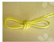
帯締め (組紐) 檸檬 (れもん) ac-0024