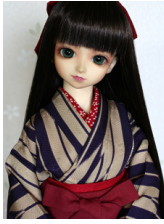
女袴と小振袖のセット紫の矢 紺と臙脂の袴SDサイズ k-0296a