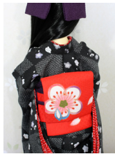
お太鼓梅SD・13SD・DD共通サイズob-0209