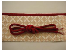
帯締め (丸くけ) 紅色(濃い赤) ac-0009