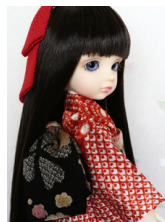
お着物セット朱色 総絞り幼 SDサイズyk-0004