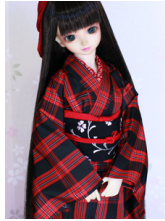
お太鼓黒地縮緬に小花 SD~16SD・DD共通 ob-0233