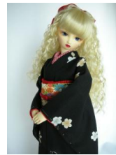
黒地に櫻 小振袖と帯のセッ トs-0001