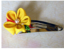
つまみ細工 髪留め山吹 am-0001