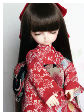
お着物セット朱色に小菊幼S Dサイズyk-0007