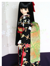
だらり帯鶉（ひわ）MSDサイズmob-0060