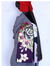
だらり帯薔薇金彩2SD~16SD・DD共通ob-0238b