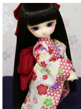
浴衣と帯のセット白地に麻の 葉幼S Dサイズyk-0017