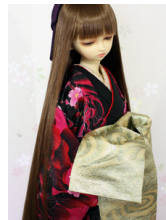
打ち掛け九重(ここのえ)S D・13SD・DD共通サイ ズk-0326