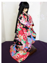
打ち掛け薄桃色に雲取りMSDサイズ mk-0071