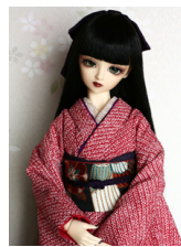
裾引き振袖臙脂(えんじ)総絞り 16少女・13少年共通サイズ k-0175