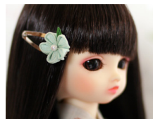
つまみ細工 髪留め薄浅葱 am-0010