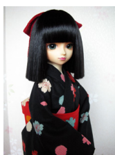
浴衣セット 黒に桜 (単衣仕立て) SDサイズk-0098