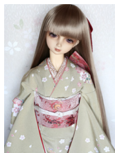
振袖雪輪に桜SD・13SD・ DD共通サイズk-0255