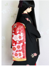
だらり帯梅と松3SD~16-SD・DD共通ob-0242