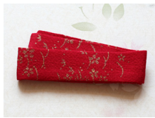
帯揚げ緋色に金彩ac-0038