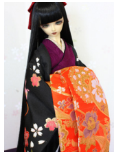
打掛セット三千歳 (みちとせ) 16少女・13少年共通サイ ズk-0310