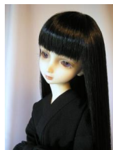
裾引き長襦袢 黒無地(前帯付き)SD、13SD、DD共通サイズn-0032