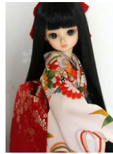
だらり帯赤地に梅柄MSDサイズ mob-0016