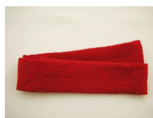
帯揚げ紅色(濃い赤) ac-0010