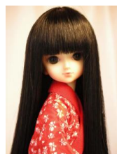
小振袖用長襦袢赤に蝶々MS Dサイズmn-0018