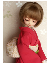
裾引き振袖色無地 躑躅色(つ つじいろ)SD・13SD・ DD共通サイズk-0169