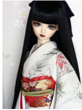
裾引き振袖楓SD・13SD・ DD共通サイズk-0209