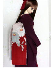
だらり帯菊花SD・13SD・ DD共通サイズob-0134