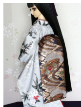
だらし帯地紙散らしSD・13SD・ DD共通サイズob-0171