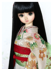
裾引き振袖薄香色に菊MSDサイズmk-0041