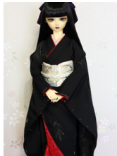
裾引き振袖黒地に梅16少女・ 13少年共通サイズk-0333