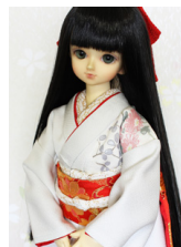
裾引き振袖朱華鹿の子MSD サイズmk-0066