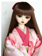
打ち掛け蘭SD・13SD・ DD共通サイズk-0213