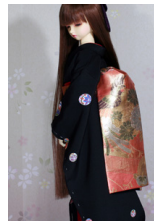
だらり帯杏色に鳳凰SD~16SD・DD共通ob-0231