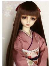
裾引き振袖櫻 灰桃色とだら り帯のセットSDサイ ズks-0086