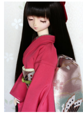
だらり帯蝶々SD・13SD・ DD共通サイズob-0180