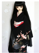
裾引き振袖朱菊SD・13S D・DD共通サイズk-0267