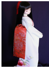
だらり帯銀朱に菊SD~16-SD・DD共通ob-0235