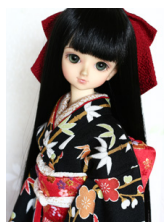
裾引き振袖梅霞MSDサイズmk-0054