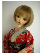
赤の雲取り 振袖 SDサイ ズk-0008