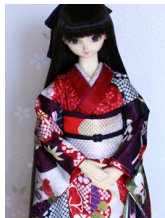
裾引き振袖菊鹿の子2 SD・13SD・DD共通k-0384