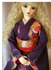
裾引き振袖 紫に菊k-0036