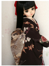
だらし帯鳳凰MSDサイズ mob-0013