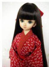
振袖用長襦袢赤に蝶々MSDサイズmn-0003