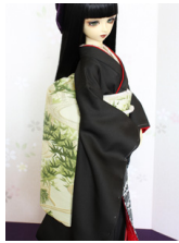
だらし帯笹流水SD・13SD D・DD共通サイズob-0197