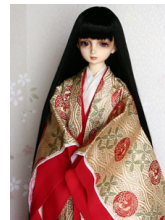
袷と単 薄香色(うすかう いろ) SD・13SD・DD共通 j-0013R