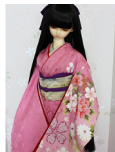
裾引き振袖桃花色に裾ぼかし 16少女・13少年共通サイ ズk-0307