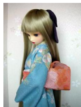
お文庫 桃花色SD、13SD、DD共通サイズ ob-0060