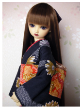
小振袖紺地 菊13SD・DD共通サイズk-0138