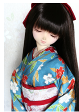
裾引き振袖桜姫SD・13SD・DD共通サイズk-0258