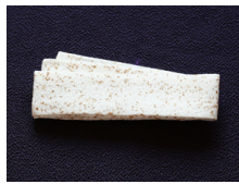
帯揚げ白地あられac-0055