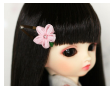
つまみ細工 髪留め桜色 am-0006