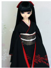
裾引き振袖黒地に赤絵 SD・13SD・DD共通k-0405