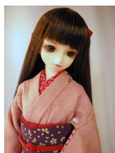
小振袖 桃色に芝桜13SDサイズk-0062