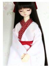
小振袖用長襦袢紅葉SDサイ ズn-0076