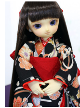
お着物セット黒地に華手鞠幼SD サイズyk-0026