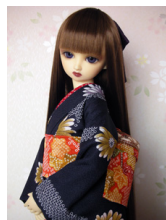
小振袖紺地 菊SDサイズk-0137