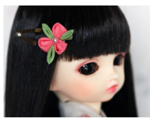
つまみ細工 髪留め紅梅 am-0007