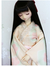
振袖用長襦袢桜(玉子色) 13SD・DD共通n-0093