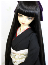
裾引き振袖黒地に赤梅16少女・13少年共通サイズk-0335