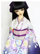
裾引き振袖八重桜SD・13 SD・DD共通サイズk-0317