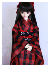
小振袖黒地に格子(大島袖)SD・13SD・DD共通k-0372