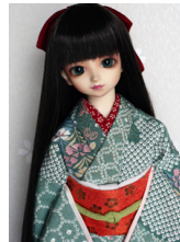
小振袖と帯のセット撫子SD・ 13SD・DD共通サイズ ks-0125