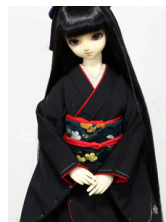
裾引き振袖黒地に梅SD・1 3SD・DD共通サイズ k-0332