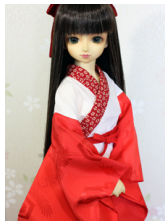
小振袖用半襦袢セット(袴用)16少女・13少年共通n-0098