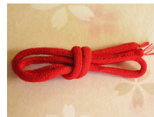
帯締め (丸くけ) 緋色 ac-0037