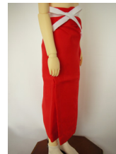
裾よけ(正絹)16少女・13少年共通ac-0004