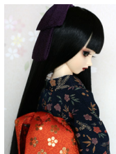
小振袖 6点セット紺地紅型13SD・DD共通ks-0005