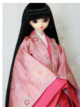
袷と単花散里(はなちるさと) SD・13SD・DD共通j-0112