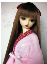
小振袖用長襦袢桃色13SD・ DD共通サイズn-0051