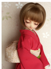
裾引き振袖色無地 躑躅色(つつじいろ) 16少女・13少年共通サイズ k-0170