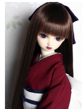
裾引き振袖色無地 臙脂(えんじ) SD・13SD・DD 共通サイズk-0165