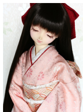
裾引き振袖菊唐草SD・13 SD・DD共通サイズk-0246