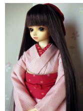
小振袖白地に小さな十字緋SD・13SD・DD共通サイズk-0142