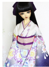
裾引き振袖八重桜 16少女・ 13少年共通サイズk-0318