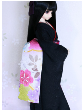
だらり帯櫻楓 (おうふう) SD~16SD・DD共通 ob-0228