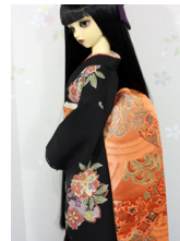
だらり帯立波 (たつなみ) S D・13SD・DD共通サイ ズob-0215