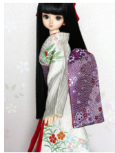
だらし帯桜MSDサイズmob-0041