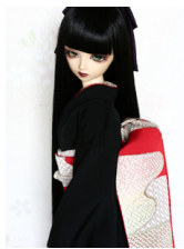
だらり帯錦(にしき)2SD・13SD・DD共通サイズob-0156b