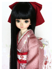
裾引き振袖花の輪 灰桃MS Dサイズmk-0047