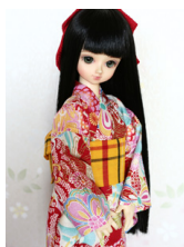
浴衣セット 流水 (単衣仕立て) MSDサイズmk-0038