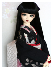
裾引き振袖黒地 菊水16少 女・13少年共通サイ ズk-0202