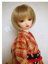
紬 赤格子柄SDサイズ