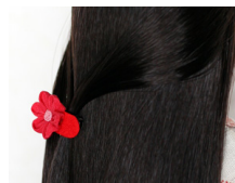
つまみ細工 髪留め茜 am-0012