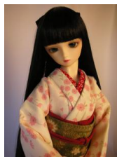
鳥の子色に小花 小振袖 (単衣仕立て) k-0037