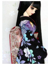
だらし帯牡丹SD・13SD・DD共通サイズob-0143