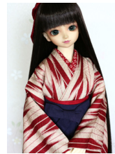
女袴と小振袖のセット赤い矢 紺と紺の袴13SD・DD共 通サイズk-0295b