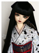
裾引き振袖櫻SD・13SD・ DD共通サイズk-0189