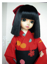
浴衣セット 赤に桜 (単衣仕立て) 13SD、DD共通サイズk-0097