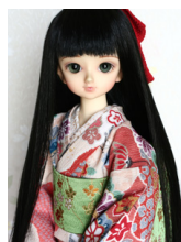
振袖セット花霞MSDサイ ズmk-0028