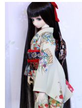
ふくら雀檜垣に菊唐草 SD~16SD・DD共通 ob-0237