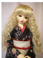
黒地花柄 秋草 小振袖 SD サイズk-0026