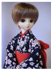
小振袖 櫻吹雪 紺地MSD サイズk-0052