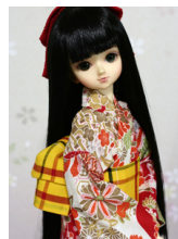
浴衣と帯のセット朱赤 花柄 MS Dサイズmk-0056