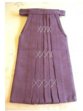
女袴 木綿13SDサイ ズj-0019