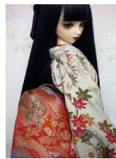
だらり帯(長尺)朱金 道長取りSD、13SD、DD共通サイズ ob-0085