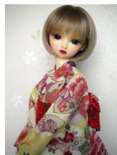
浴衣セット 牡丹 檸檬色 (単衣仕立て) SDサイズk-0104