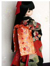
裾引き振袖 4点セット黒地に雲取りMSDサイズ mks-0002