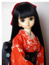
裾引き振袖しだれ桜MSDサイズmk-0012