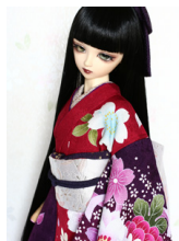
裾引き振袖宵の桜SD・13 SD・DD共通サイズk-0238