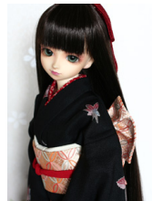
ふくら雀七宝SD・13SD・DD共通サイズob-0139