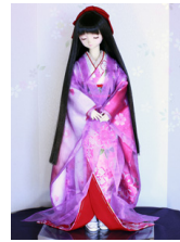
薄衣 (うすごろも) 紫 SD・13SD・DD共通k-0355