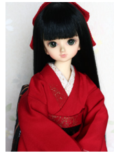
裾引き振袖赤姫MS Dサイズ mk-0029