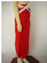
裾よけ(正絹)SD・13SD・DD共通ac-0002