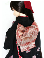
ふくら雀梅重ねSD・13SD・DD共通サイズob-0142