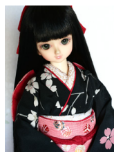
裾引き振袖薄墨MSDサイズ mk-0043