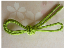
帯締め（組紐）萌黄（もえぎ） ac-0023