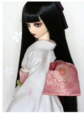
お文庫桃花色に華紋SD・13SD・DD共通サイズ ob-0130