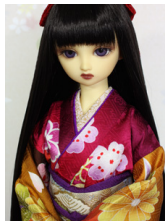
裾引き振袖牡丹SD・13SD・DD共通サイズk-0348