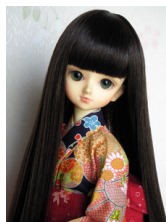
浴衣セット 紺地 菊柄 (単衣仕立て) MSDサイズ mk-0005