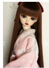
振袖用長襦袢櫻SDサイズ n-0059