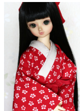
振袖用長襦袢梅鉢(うめばち)MSDサイズmn-0021