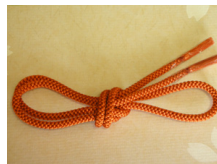
帯締め（組紐）柿色（かきいろ） ac-0022