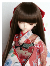
お着物セット花霞幼SDサイ ズyk-0002