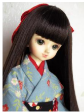
小振袖 薄浅葱MS Dサイズmk-0001