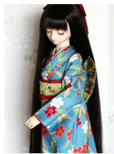
振袖桜姫SD・13SD・DD共通サイズk-0259