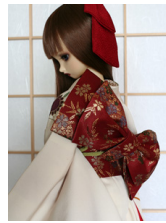
立て矢臙脂に花丸SD・13SD・DD共通サイズ ob-0124