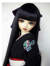
裾引き振袖黒地に鈴柄16少女・13少年共通サイズ k-0129