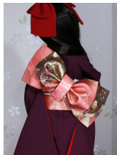
立て矢杏色SD~16SD・DD共通ob-0232