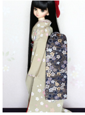
だらり帯桜流水MSDサイズ mob-0051