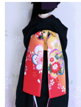
だらり帯紅ぼかしSD~16-SD・DD共通ob-0227