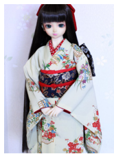
小振袖花籠(はなかご)SD・13SD・DD共通k-0379