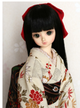
裾引き振袖流水に華MSDサイズmk-0017