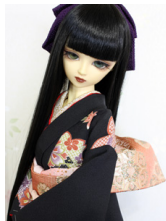
裾引き振袖黒地に桜花SD・ 13SD・DD共通サイ ズk-0322