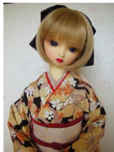
裾引き振袖櫻SD、13SD、DD共通サイズk-0082