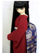
だらり帯松に鶴丸SD・13 SD・DD共通サイズ ob-0213