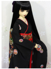
裾引き振袖黒地に手鞠16少女・13少年共通k-0342