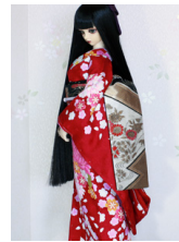
だらり帯菱紋に秋草SD~ 16SD・DD共通ob-0223