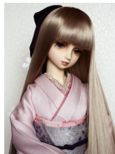
裾引き振袖色無地 薄櫻SD・ 13SD・DD共通サイ ズk-0185