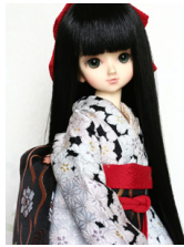
裾引き振袖櫻MS Dサイズ mk-0030