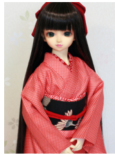
小振袖朱色十字緋SD・13-SD・DD共通k-0402