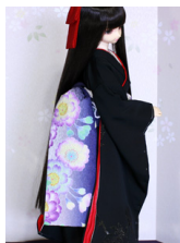
だらし帯八重桜2SD~16-SD・DD共通ob-0221