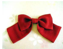
リボン 赤 Lサイズ ac-0012R