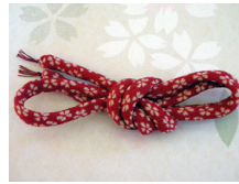
帯締め (丸くけ) 赤に櫻 ac-0040