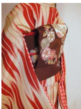
お太鼓 花丸SD、13SD、DD共通サイズob-0044