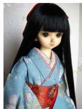
裾引き振袖セット水縹(みずはなだ)MSDサイズmk-0010