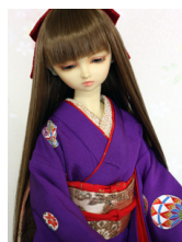
裾引き振袖紫に手鞠SD・ 13SD・DD共通k-0347