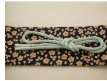
帯締め（組紐）瓶覗（かめのぞき）ac-0005