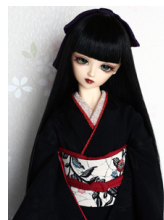
裾引き振袖黒地 薔薇SD・ 13SD・DD共通サイ ズk-0149R