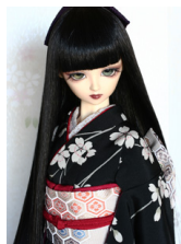
裾引き振袖薄墨SD・13SD・DD共通サイズk-0242