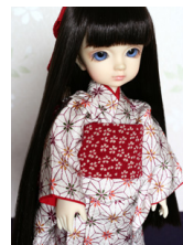
お着物セット麻の葉幼SDサイ ズyk-0005