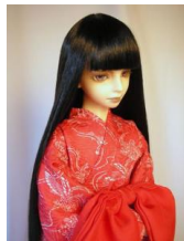
裾引き長襦袢 薄赤 小振袖SD、13SD、DD共通サイズgn-0009