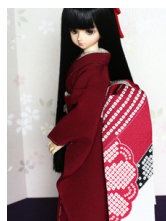
だらり帯吉祥MSDサイズmob-0058