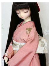
お文庫金更紗SD・13SD・ DD共通サイズob-0189