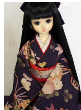
裾引き振袖華手鞠MSDサイズmk-0073