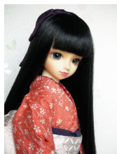
小振袖 梅と松葉(単衣仕立て)13SD・DD共通サイズ k-0089