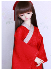
振袖用長襦袢緋色13SD・DD 共通n-0002