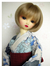
浴衣セット 青菊 (単衣仕立て) SDサイズk-0116