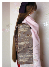
だらり帯鳳凰SD、13SD、DD共通サイズ ob-0079