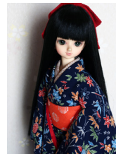
裾引き振袖 4点セット紺地 紅型MSDサイズmks-0004