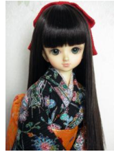
黒地紅型風 裾引き振袖MS Dサイズmk-0003