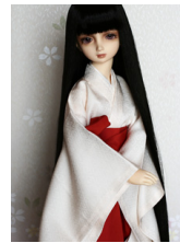
長袴緋色(ひいろ) SD・- 13SD・DD共通j-0103