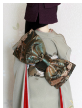
立て矢孔雀色SD~16SD・DD共通ob-0246