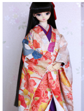
打ち掛け八千代16少女・13少年共通k-0365