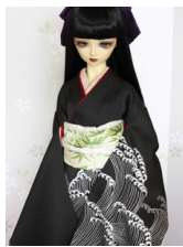
裾引き振袖波 16少女・13 少年共通サイズk-0320