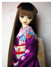
裾引き振袖牡丹SD・13SD・DD共通サイズk-0152