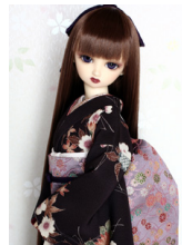
裾引き振袖葡萄色(えびいろ)吹き寄せ16少女・13少年共通サイズk-0158