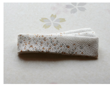
帯揚げ白地に金銀あられ ac-0063