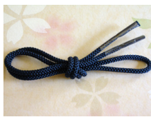
帯締め (組紐) 藍色ac-0014