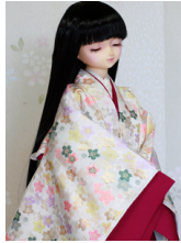
袷と単浮舟 (うきふね) SD・13SD・DD共通j-0114