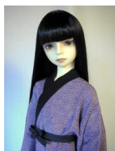
少年用長襦袢狛菊(むじなざく)13SD少年サイズbn-0013