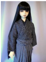
袴セット青海波(せいかいは) 13SD少年サイズs-0006