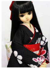
裾引き振袖吉祥 (きっしょう) MSDサイズmk-0070