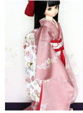
だらり帯ねじ梅MSDサイズ mob-0052