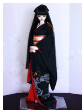
裾引き振袖黒地に貝桶(かい おけ)16少女・13少年共通 k-0367