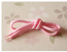
帯締め (丸くけ) 桃色 ac-0044