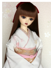
裾引き振袖卯の花色に吹き寄 せ16少女・13少年共 通サイ ズk-0195