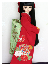
だらり帯若草MSDサイズmob-0028