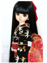
だらり帯紅唐草MS Dサイズ mob-0055