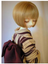
裾引き振袖矢絰 紫SD、1 3SD、DD共通サイズ k-0056