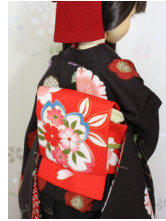
お太鼓桜SD・13SD・DD共通サイズob-0210