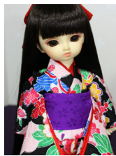
お着物セット薄桃色に雲取り 幼SDサイズyk-0022