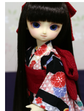
浴衣と帯のセット黒地に麻の 葉幼SDサイズyk-0018