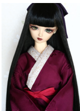
振袖用長襦袢葡萄色（ぶどういろ）13SD・DD共通 n-0065