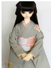
裾引き振袖裏柳葉SD・13- SD・DD共通k-0400