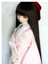
振袖用長襦袢薄桃ぼかし 13SD・DD共通n-0071