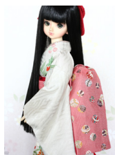
だらし帯手まりMSDサイズ mob-0047