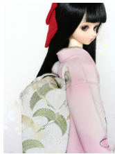
だらり帯白地に鶴MSDサイ ズmob-0034