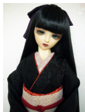
裾引き振袖黒地 薔薇SD・13SD・DD共通サイズk-0149