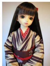
小振袖 矢紺 紫SDサイズ k-0063