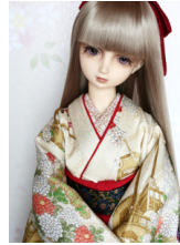
裾引き振袖花車SD・13SD D・DD共通サイズk-0207