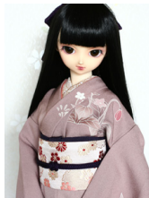
だらり帯雪輪SD・13SD・ DD共通サイズob-0095R