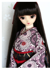
裾引き振袖菊唐草SD・13SD・DD共通サイズk-0281