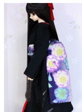
だらし帯八重桜1SD~16-SD・DD共通ob-0220