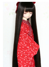
小振袖用長襦袢松葉SDサイ ズn-0067