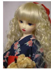
小振袖紺地紅型風小紋SDサイズk-0023