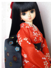
だらり帯五つ木瓜MSDサイズ mob-0009