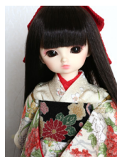
お着物セット花車幼SDサイ ズyk-0006