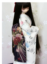
だらし帯華手鞠SD・13SD D・DD共通サイズob-0183