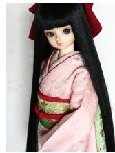
裾引き振袖菊唐草MS Dサイ ズmk-0046