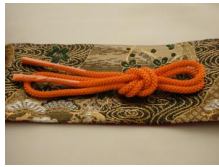
帯締め（組紐）橙色（だいだいいいろ）ac-0008