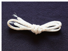
帯締め (丸くけ) 白地あられ ac-0056