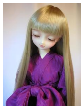
裾引き長襦袢 紫(前帯付き)SD・13SD・DD共通サイズn-0033