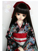
振袖 6点セット黒地紅型風 13SD・DD共通サイズ ks-0002