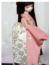
だらし帯金更紗SD・13SD D・DD共通サイズob-0187