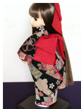
お着物セット桜短冊幼SDサイ ズyk-0014