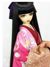
打ち掛け花毬(はなむら)S D・13SD・DD共通サイ ズk-0329