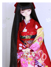
裾引き振袖菊と手鞠SD・ 13SD・DD共通k-0358