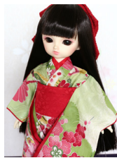
お着物セット鶺鴒色(ひわいろ) 幼SDサイズyk-0015