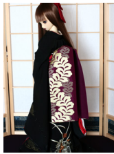
だらり帯藤花房SD・13SD・DD共通サイズ ob-0126