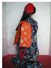
だらり帯 朱に金MSDサイズ mob-0002