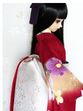
だらし帯銀櫻 3SD・13SD SD・DD共通サイズ ob-0146c