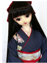
裾引き振袖深藍色に花の輪S D・13SD・DD共通サイ ズk-0303