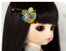
つまみ細工 髪留め浅葱 am-0009