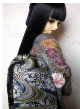
だらり帯櫻に流水SD、13SD、DD共通サイズ ob-0082