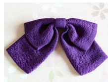
リボン 紫(堇色) Mサイズ ac-0064