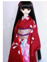
裾引き振袖牡丹SD・13SD・ DD共通k-0387