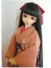
小振袖 犬張子SDサイズ k-0078