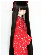
小振袖用長襦袢松葉13SD・ DD共通n-0068