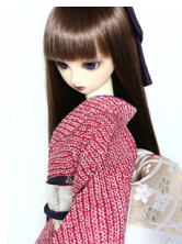
裾引き振袖臙脂(えんじ)総絞りSD・13SD・DD共通サイズk-0198