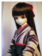
女袴 深緑13SDサイズ j-0014