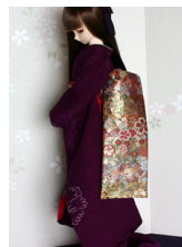
だらり帯枝垂れ桜SD・13 SD・DD共通サイズ ob-0172