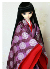
袷と単六条院(ろくじょうい ん)SD・13SD・DD共通 j-0111