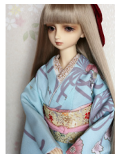
裾引き振袖大菊16少女・13少年共通サイズk-0200