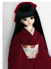
裾引き振袖色無地 臙脂(えんじ)MSDサイズmk-0019