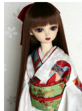
裾引き振袖手鞠SD・13SD D・DD共通サイ ズk-0192