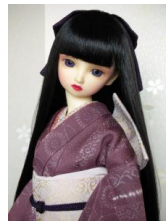
裾引き振袖藤紫SD・13SD・DD共通サイズk-0085