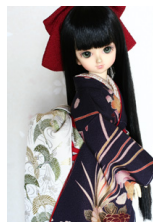
裾引き振袖華手鞠（はなてまり）MSDサイズmk-0044