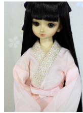
振袖用長襦袢薄桃MSDサイ ズmn-0023