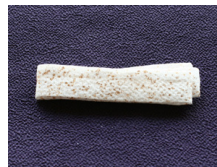
帯揚げ白地あられMSDサイズ mac-0003