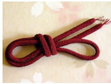
帯締め (丸くけ) 臙脂 (えんじ) ac-0035