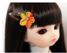
つまみ細工 髪留めくちなし am-0008