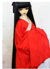
裾引き長襦袢と前帯のセット 緋色SD・13SD・DD 共通サイズn-0095