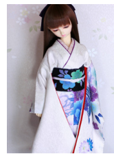
裾引き振袖蒼牡丹SD・13SD・DD共通k-0363