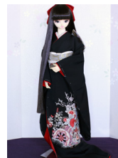
裾引き振袖花車16少女・13少年共通k-0357