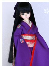
裾引き振袖紫に手鞠MSDサイズ mk-0075