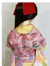
ふくら雀辻が花SD~16SD・ DD共通ob-0244