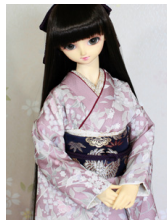
裾引き振袖浅蘇芳(あさすお う)SD・13SD・DD共通 k-0394