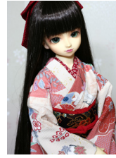
小振袖花霞SD・13SD・DD共通サイズk-0262