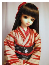
小振袖 矢紺 赤13SD、 DD共通サイズk-0066