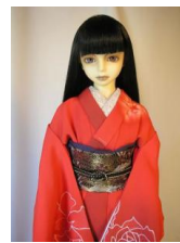
裾引き振袖赤薔薇 16少女・ 13少年共通サイズk-0051