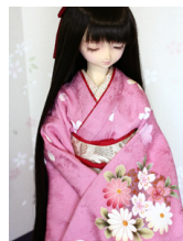
裾引き振袖桃花色に裾ぼかし SD・13SD・DD共通サ イズk-0306