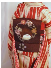
お太鼓 兎SD、13SD、DD共通サイズob-0043