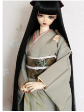
裾引き振袖裏柳葉16少女・13少年共通k-0401