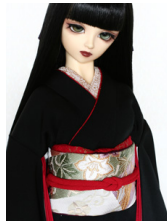
だらし帯短冊SD・13SD・DD共通サイズob-0144