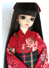
浴衣セット 薔薇 赤 (単衣仕立て) SD・13SD・DD共通サイズk-0226