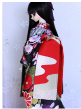
だらり帯錦(にしき)5 SD~16SD・DD共通 ob-0156e