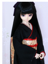
裾引き振袖黒無地 紗綾形16 少女・13少年共通k-0368