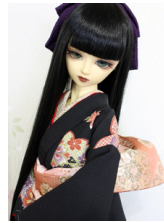
裾引き振袖黒地に桜花 16少女・13少年共通サイズ k-0323