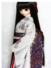
だらり帯紺地に枝梅SD・1 3SD・DD共通サイズ ob-0175