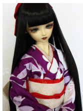
裾引き振袖若紫にしだれ桜 16少女・13少年共通サイズ k-0315