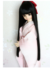
振袖用長襦袢兎MSDサイズ mn-0019