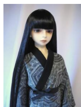
少年用長襦袢亀甲(きっこう)13SD少年(ロング足)サイズbn-0016