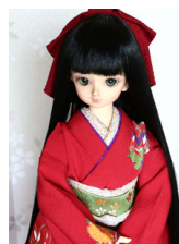
裾引き振袖手鞠と蝶々MSDサイズmk-0052