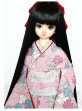
裾引き振袖蓮華(れんげ)MS Dサイズmk-0035