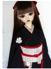
裾引き振袖墨色に桜16少女・ 13少年共通サイズk-0271