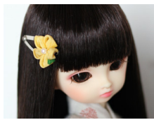
つまみ細工 髪留めたんぽぽ am-0005