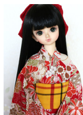
浴衣セット 朱花 (単衣仕立て) MSDサイズmk-0037