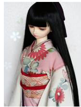
裾引き振袖花友禅SD・13 SD・DD共通サイズk-0224