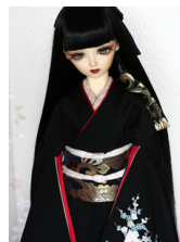
裾引き振袖華屏風(はなびょう ぶ)SD・13SD・DD 共通サイズk-0265