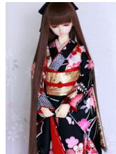
裾引き振袖黒地花吉祥16少 女・13少年共通k-0370