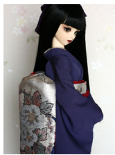
だらし帯雅(みやび)SD・ 13SD・DD共通サイズ ob-0094