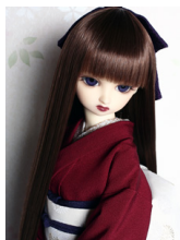
裾引き振袖色無地 臙脂(えんじ)16少女・13少年共通サイズ