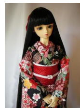
小振袖 黒地染め絢 SDサ イズk-0049