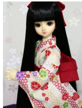
浴衣と帯のセット白地に麻の葉MSDサイズmk-0062