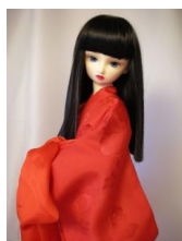
裾引き長襦袢 緋色 小振袖 n-0023