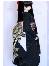
だらり帯薔薇金彩1SD~16SD・DD共通ob-0238a