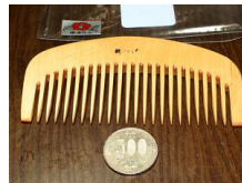
つげ櫛(椿油仕上げ 純つげ櫛) ar-0001