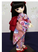
浴衣と帯のセット手鞠 薄紅 幼S Dサイズyk-0019