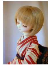
裾引き振袖矢絰 赤SD、1 3SD、DD共通サイズ k-0055