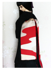
だらり帯錦(にしき)1SD・13SD・DD共通サイズob-0156a