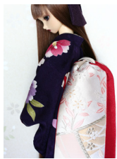
だらし帯銀櫻 4SD・13SD SD・DD共通サイズ ob-0146d