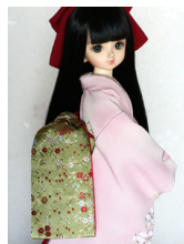
だらり帯萌黄（もえぎ）MSDサイズmob-0048