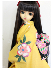
小振袖と帯のセット山吹SD・13SD・DD共通k-0302