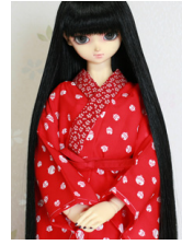
小振袖用長襦袢紅色に鈴柄 13SD・DD共通n-0115