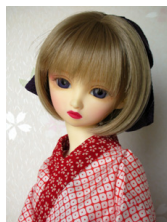
紬用長襦袢赤 鹿の子柄SD サイズ