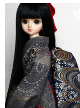
だらし帯櫻に流水MSDサイ ズmob-0015