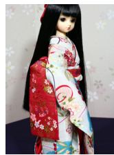
だらり帯朱色に花丸MS Dサイズ mob-0054