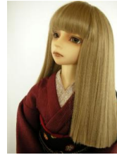
裾引き振袖 臙脂(えんじ) に黒縞k-0018