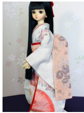
だらり帯薄紅(うすくれない) MS Dサイズmob-0062