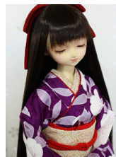
裾引き振袖若紫にしだれ桜S D・13SD・DD共通サイ ズk-0311