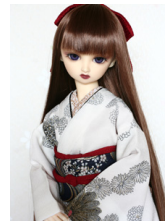
裾引き振袖菊重ねSD・13 SD・DD共通サイズk-0221