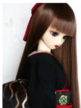
裾引き振袖黒地に刺繍SD・ 13SD・DD共通サイズ k-0212