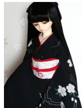
裾引き振袖桜と兎SD・13SD D・DD共通サイズk-0247