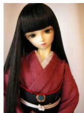
裾引き振袖色無地 蘇芳(すおう)16少女・13少年共通サイズk-0031