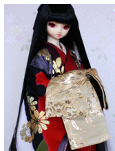
打ち掛け音羽(おとわ)16 少女・13少年共通k-0351