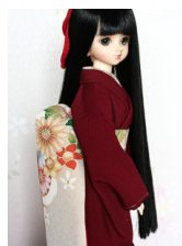
だらし帯染め菊花MSDサイズ mob-0043