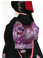
ふくら雀桜SD・13SD・DD共通サイズob-0141