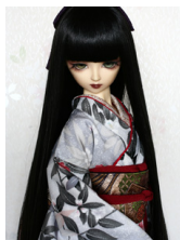
裾引き振袖沙羅16少女・13少年共通サイズk-0279