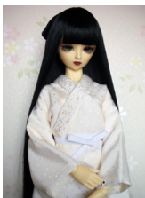
小振袖用長襦袢水玉13SD・ DD共通サイズn-0049