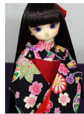
お着物セット黒地に手鞠と桜 幼SDサイズyk-0023