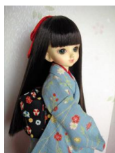
お文庫 かざぐるまMSDサイズ mob-0001