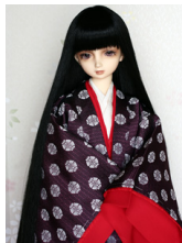
袷と単 向い蝶 紫(むらさ き) SD・13SD・DD共通 j-0012R