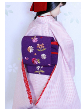
お太鼓野菊SD~16SD・DD 共通ob-0239