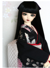
裾引き振袖黒地 菊水SD・ 13SD・DD共通サイズ k-0201