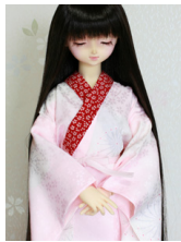
小振袖用長襦袢薄桃ぼかしSD サイズn-0114