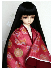
袷と単 桃花色(ももはな いろ) SD・13SD・DD共通 j-0009R