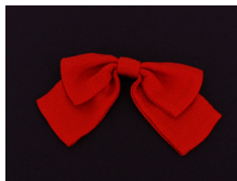
リボン 緋色 Lサイズ ac-0065