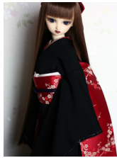
だらり帯赤地に梅柄SD、13SD、DD共通サイズ ob-0086