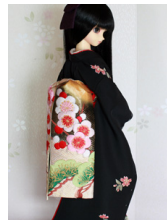
だらり帯梅と松2SD~16-SD・DD共通ob-0241