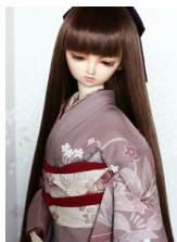
裾引き振袖春の調べSD・1 3SD・DD共通サイズ k-0266