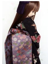
だらり帯小菊SD、13SD、 DD共通サイズob-0087