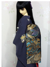
だらり帯孔雀SD・13SD・ DD共通サイズob-0216