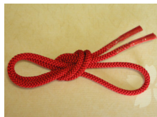
帯締め（組紐）茜（あかね） ac-0021