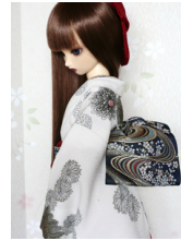
お文庫櫻に流水SD・13S D・DD共通サイズob-0083