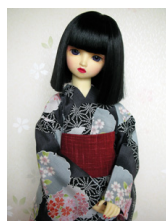
浴衣セット 雪輪に櫻 (単衣仕立て) 13SD、DD共通サイズk-0114