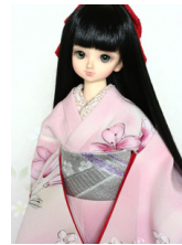
裾引き振袖躑躅(つつじ)M SDサイズmk-0033