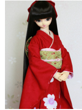
振袖紅に桜花SD・13SD・ DD共通k-0404