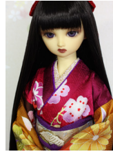
裾引き振袖牡丹16少女・13少年共通サイズk-0349