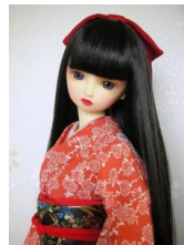
裾引き振袖朱色に小菊SD、13SD、13少年、16少女サイズに対応k-0081