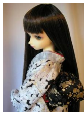
お文庫 黒地にあられSD、13SD、DD共通サイズob-0048