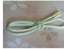
帯締め（組紐）薄荷（はっか） ac-0025