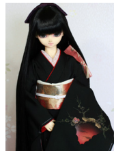
裾引き振袖枝梅SD・13SD・ DD共通k-0396