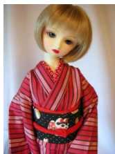
お太鼓 黒地 玩具柄SD、13SD、DD共通サイズob-0046