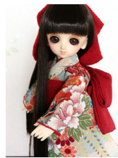
お着物セット水浅黄(みずあ さぎ)幼SDサイズyk-0012