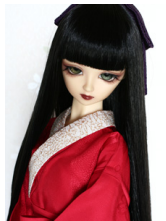
振袖用長襦袢紅色SDサイズ n-0101