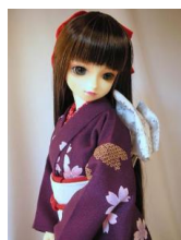
小振袖 紫に桜花SDサイズk-0059