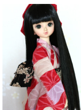
浴衣セット 市松に麻の葉 (単衣仕立て) MSDサイズmk-0036