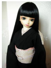
立て矢花立涌 (はなたてわく) SD、13SD、DD共通サイズ ob-0056