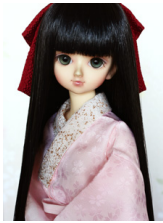
振袖用長襦袢桜ぼかしMSD サイズmn-0018