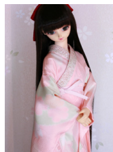
振袖用長襦袢桜(薄紅色) 13SD・DD共通n-0112