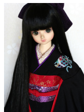
裾引き振袖黒地に鈴柄MS D サイズmk-0045