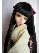
小振袖 兎と櫻13SDサイ ズk-0077