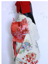
ふくら雀銀朱に菊SD~16- SD・DD共通ob-0236