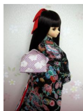
お文庫 梅に鹿の子MSDサイズ mob-0007