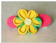
つまみ細工 髪留め山吹 am-0003