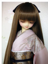
裾引き振袖秋草SD・13SD・DD共通サイズk-0150