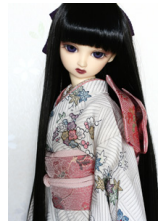
裾引き振袖枝梅SD・13SD・DD共通サイズk-0275