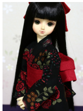
浴衣と帯のセット黒地に薔薇 MS Dサイズmk-0057