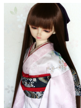
裾引き振袖花筏(はないかだ) SD・13SD・DD共通サ イズk-0260