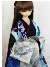
前帯 片流し雪輪SD・13SD・DD共通サイズob-0206