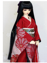
裾引き振袖菊鹿の子16少女・13少年共通k-0407