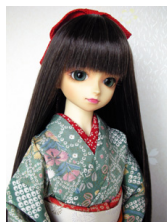
小振袖撫子13SDサイズ k-0126