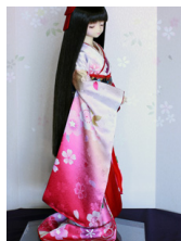
裾引き振袖桜に紅ぼかし SD・13SD・DD共通k-0377