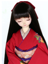
裾引き振袖手鞠と蝶々SD・ 13SD・DD共通サイズ k-0252