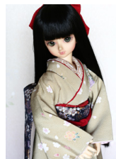
裾引き振袖雪輪に櫻MSDサイズmk-0053