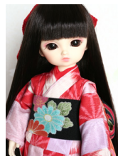
お着物セット市松に麻の葉幼 SDサイズyk-0009