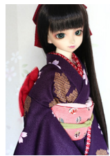
ふくら雀手まりSD・13SD D・DD共通サイズob-0147