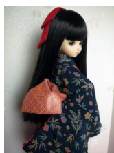
お文庫 菱紋MSDサイズ mob-0004