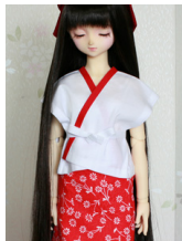
肌襦袢SD~16少女・DD共通ac-0001