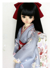
裾引き振袖花の輪 薄藤色MSDサイズmk-0048