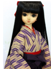
女袴と小振袖のセット紫の矢 紺と紺の袴MSDサイズ mk-0069