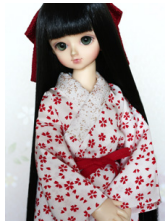
振袖用長襦袢白地に桜MSD サイズmn-0017