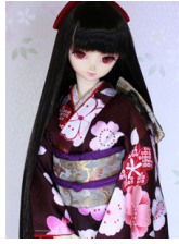
裾引き振袖桜花16少女・13少年共通k-0353