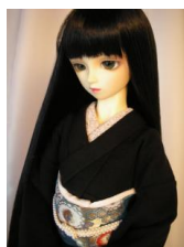
裾引き振袖黒無地に菊柄16少女・13少年共通サイズ k-0014