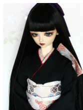
裾引き振袖黒無地 16少女・ 13少年共通サイズk-0312