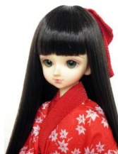
振袖用長襦袢紅葉MSDサイズmn-0004