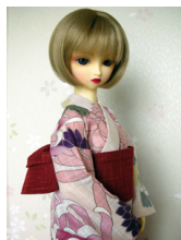
浴衣セット 赤菊 (単衣仕立て) 13SD、DD共通サイズk-0119