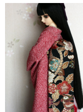
だらし帯唐織風SD、13SD、 DD共通サイズob-0054