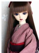
小振袖 万筋(単衣仕立て)S D・13SD・DD共通サイ ズk-0178