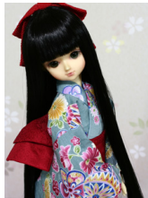
浴衣と帯のセット手鞠 水縹 MS Dサイズmk-0065