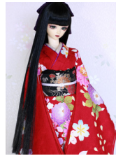
裾引き振袖桜菊花(さくらきっか)16少女・13少年共通k-0360