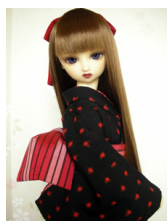
紬黒地に赤の緋柄SDサイズ