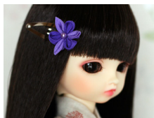
つまみ細工 髪留め堇(すみれ) am-0011