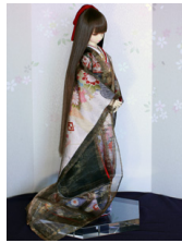
薄衣 (うすごろも) 海松茶 (みるちゃ) 16少女・13少年共通k-0356