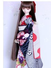
だらり帯錦(にしき)4SD~16SD・DD共通ob-0156d