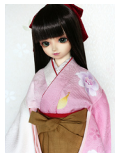
女袴と中振袖・半襦袢セット SDサイズhs-0001