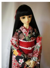
小振袖 黒地染め絢 13SD、 DD共通サイズk-0050