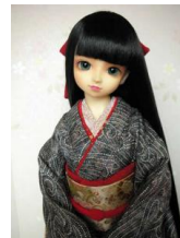
裾引き振袖黒地に波（八掛 淡赤）SD、13SD、DD サイズk-0073