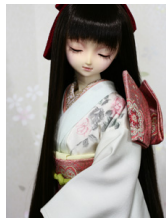
裾引き振袖薔薇SD・13SD D・DD共通サイ ズk-0300