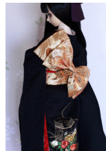
立て矢金熨斗目(きんのしめ)SD~16SD・DD共通 ob-0230