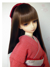
裾引き振袖江戸小紋SDサイズk-0127