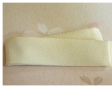
帯揚げ香色 (こういろ) ac-0029