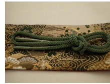
帯締め（組紐）木賊色（とくさいろ）ac-0006