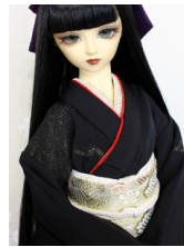
だらし帯松ヶ枝SD・13SD・DD共通サイズob-0203