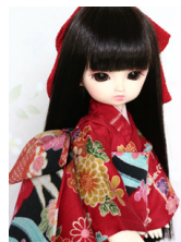
お着物セット花友禅幼SDサ イズk-0010