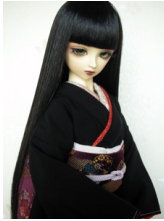
裾引き振袖黒無地 16少女・ 13少年共通サイズk-0022