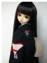
小振袖 黒地飛び柄13SDサイズ・DD共通サイズk-0058