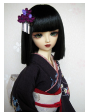
裾引き振袖濃紫に花輪SD・13SD・DD共通サイズ k-0123