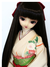
裾引き振袖御所解きSD・1 3SD・DD共通サイ ズk-0299