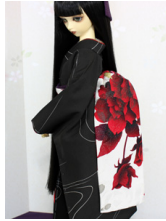
だらし帯紅薔薇SD・13SD・DD共通サイズob-0214