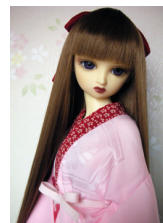
小振袖用長襦袢桃色SDサイ ズn-0050