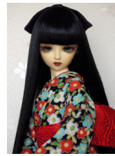
小振袖黒地に椿SDサイズk-0133