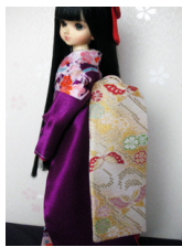
だらり帯蝶々MSDサイズ mob-0014