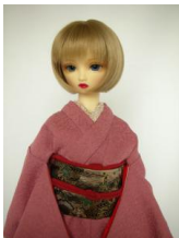
色無地 裾引き振袖 紅藤(べ にふじ) SDサイズk-0010