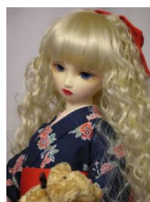
紺地紅型風小紋 小振袖 13SD、DD共通サイズk-0024