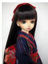
紬のセット格子紬 紺SDサ イズ