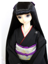
振袖百合SD・13SD・D D共通サイズk-0331