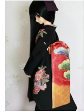
だらり帯梅と松4SD~16-SD・DD共通ob-0243