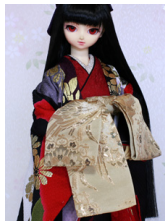
前帯 片流し鳳凰 (ほうおう) SD・13SD・DD共通 ob-0217