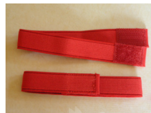
伊達締め (2本組み) ac-0020