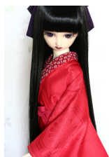
小振袖用長襦袢緋色13SD・DD共通n-0081