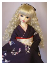
裾引き振袖濃紫に花輪16少女・13少年共通サイズ k-0020