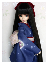
小振袖瑠璃(るり)SD・13SD・DD共通サイズk-0162