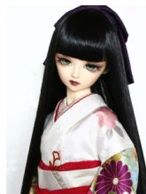
裾引き振袖花宴（はなのえん） SD・13SD・DD共通サ イズk-0237