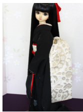
だらり帯金更紗MS Dサイズ mob-0061