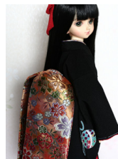
だらり帯枝垂れ桜MS Dサイズ mob-0059