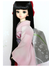
だらり帯櫻MSDサイズ mob-0019