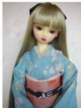
裾引き振袖水縹 (みずはなだ) SD・13SD・DD共通サイズk-0080