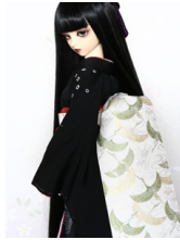
だらり帯白地に鶴SD・13 SD・DD共通サイズ ob-0131