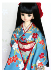
裾引き振袖桜姫MSDサイズmk-0055