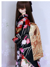
だらり帯金熨斗目(きんのしめ)SD~16SD・DD共通 ob-0229