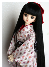
小振袖麻の葉(単衣仕立て)M SDサイズmk-0016