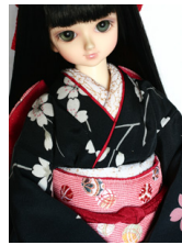
ふくら雀手まりMSDサイズmob-0046