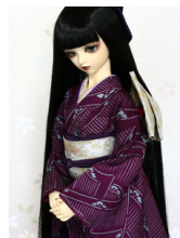
裾引き振袖二藍(ふたあい) SD・13SD・DD共通サ イズk-0248