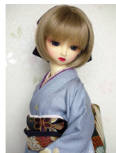
裾引き振袖櫻 薄藤色SD・13SD・DD共通サイズ k-0087