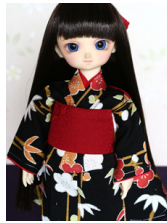
お着物セット黒地に梅幼SD サイズyk-0016