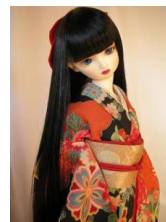
裾引き振袖黒地に雲取りSD、 13SD、DD共通サイズ k-0046