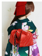
お文庫朱色金彩SD~16SD・ DD共通ob-0251