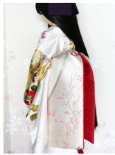
だらし帯銀櫻 1SD・13SD SD・DD共通サイズ ob-0146a