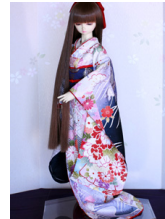
裾引き振袖白地に花吉祥16少女・13少年共通k-0376