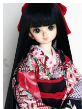
小振袖セット黒地の染め紬M SDサイズmks-0007