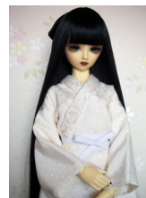
小振袖用長襦袢水玉SDサイ ズn-0048