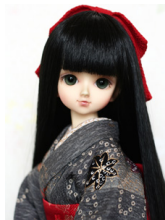
裾引き振袖櫻に金彩MSDサイズmk-0015