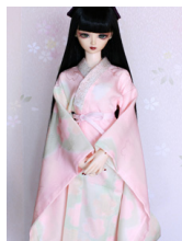
振袖用長襦袢桜(薄紅色)16少女・13少年共通n-0113