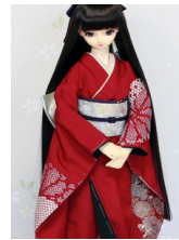
裾引き振袖菊鹿の子SD・ 13SD・DD共通k-0406