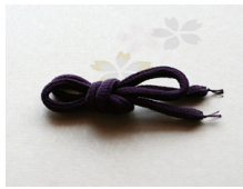
帯締め (丸くけ) 紫ac-0036