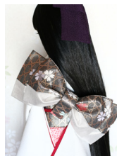
立て矢籠目に桜SD・13SD D・DD共通サイズob-0182