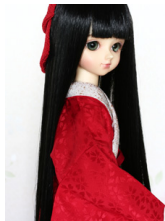
振袖用長襦袢緋色MSDサイズmn-0001