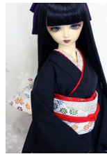
お文庫雲取亀甲(くもどりきっこう)SD・13SD・DD共通サイズob-0191