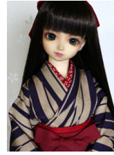
女袴と小振袖のセット紫の矢 紺と臙脂の袴13SD・DD 共通サイズk-0296b