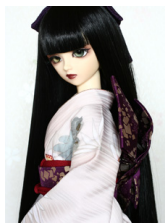
立て矢色紙散らし 紫SD・13SD・DD共通サイズ ob-0127