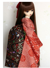
だらし帯黒地 桜SD・13 SD・DD共通サイズ ob-0092