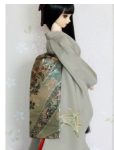
だらり帯孔雀色SD~16SD・DD共通ob-0247