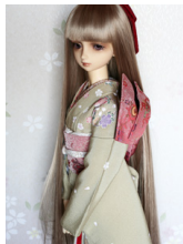
立て矢花唐草SD・13SD・ DD共通サイズob-0154