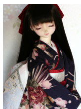
裾引き振袖華手鞠（はなてまり）SD・13SD・DD共通 サイズk-0245