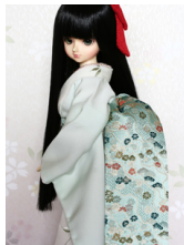
だらり帯千種色(ちぐさいろ) に小花MSDサイズmob-0- 030