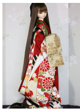
打ち掛け春日野(かすがの)16少女・13少年共通k-0361