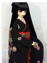
裾引き振袖黒地に手鞠 SD・13SD・DD共通k-0341