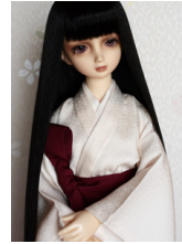
十二単用下着セット 綸子のお 着物と肌着SD・13SD・DD 共通j-0101