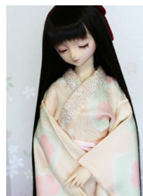
振袖用長襦袢桜（玉子色）SD サイズn-0092