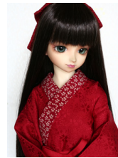
小振袖用長襦袢紅色SDサイ ズn-0090