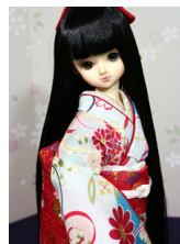
裾引き振袖花の舞MSDサイズ mk-0061