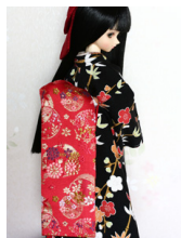
だらり帯朱色に花丸MSDサイズmob-0049