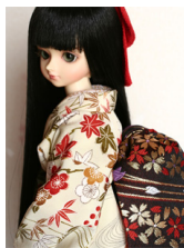
だらし帯黒地 桜MSDサイ ズmob-0019