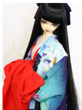
打ち掛け高尾(たかお)16 少女・13少年共通サイズ k-0328