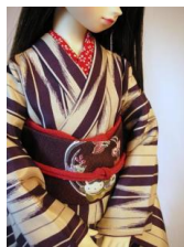
お太鼓 犬張子SD、13SD、DD共通サイズob-0042