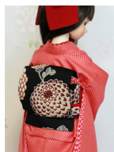
お太鼓裏菊(うらぎく) 1 SD~16SD・DD共通 ob-0252