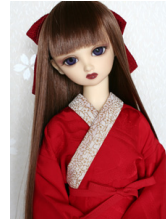
振袖用長襦袢緋色SDサイズ n-0001