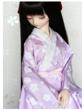
振袖用長襦袢白梅SDサイズ n-0086