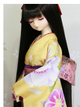
お文庫辻が花SD~16SD・ DD共通ob-0245