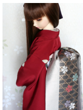
だらし帯籠目に桜SD・13SD・ DD共通サイズob-0181