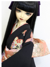
お文庫曙SD・13SD・DD共通サイズob-0202