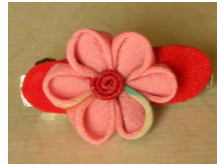
つまみ細工 髪留め濃い桃 am-0002