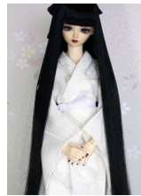
振袖用長襦袢白16少女・13少年共通n-0108