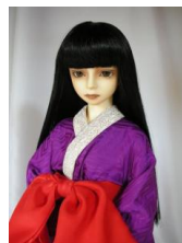
振袖用長襦袢紫 紗綾形16 少女・13少年共通n-0023