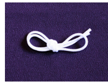
帯締め (江戸打ち紐) 白ac-0067