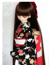
裾引き振袖梅霞SD・13SD D・DD共通サイズk-0256