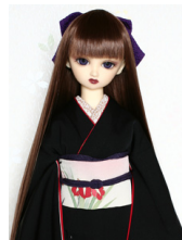
裾引き振袖黒地に刺繍SD・ 13SD・DD共通サイズ k-0222