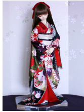
裾引き振袖菊鹿の子SD・ 13SD・DD共通k-0382