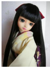
小振袖 兎と櫻SDサイズ k-0076