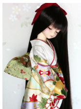
お文庫萌黄(もえぎ)SD・13SD・DD共通サイズob-0152