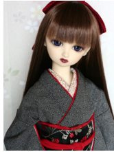
裾引き振袖江戸小紋 黒地 梅SD・13SD・DD共通 サイズk-0196