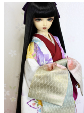
打ち掛け初音(はつね)16 少女・13少年共通サイズ k-0330