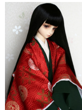
袷と単 紅緋(べにひ) SD・13SD・DD共通 j-0008R