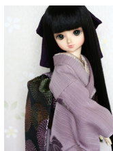
だらし帯花火MSDサイズ mob-0022