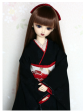
裾引き振袖黒無地 梅SD・ 13SD・DD共通サイズ k-0205