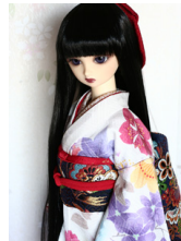
裾引き振袖牡丹SD・13SD D・DD共通サイズk-0261