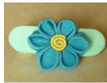
つまみ細工 髪留めはなだ色 am-0004