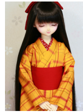
小振袖黄八丈SD・13SD・DD共通k-0403