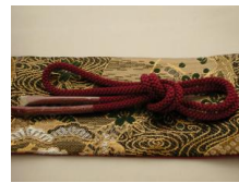
帯締め（組紐）赤葡萄酒色（あかえびいろ）ac-0007