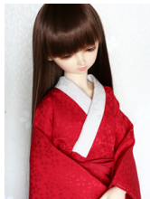
小振袖用長襦袢緋色13SD・ DD共通n-0083