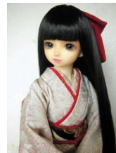
裾引き振袖 牡丹SD、13 SD、DDサイズk-0075