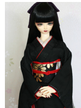
裾引き振袖黒無地 流水 SD・13SD・DD共通k-0392