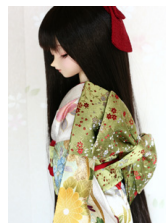
立て矢萌黄(もえぎ)SD・13SD・DD共通サイズob-0151