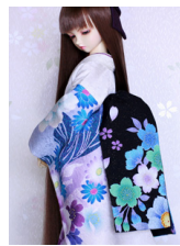
だらし帯八重桜3SD~16-SD・DD共通ob-0178