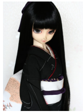
裾引き振袖黒地に流水SD・13SD・DD共通サイズk-0277