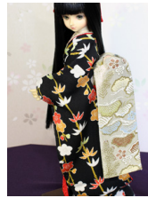
だらり帯松ヶ枝MS Dサイズ mob-0063