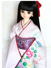
裾引き振袖花筏（はないかだ） MS Dサイズmk-0051