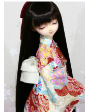
浴衣と帯のセット白地に花柄金彩SD・13SD・DD共通サイズk-0287