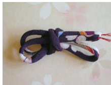
帯締め (丸くけ) 紫に櫻 ac-0015