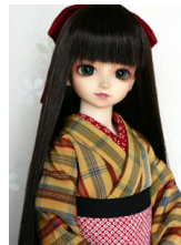
小振袖黄格子(単衣仕立て)SD D・13SD・DD共通サイ ズk-0190