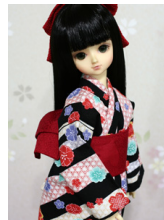
浴衣と帯のセット黒地に麻の 葉MS Dサイズmk-0063