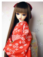
裾引き振袖しだれ桜SD・13SD・DD共通サイズk-0151