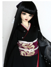
裾引き振袖孔雀SD・13SD D・DD共通サイズk-0220