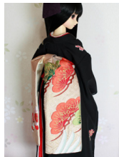
だらり帯梅と松1SD~16-SD・DD共通ob-0240