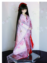
薄衣(うすごろも)桜16少 女・13少年共通k-0354