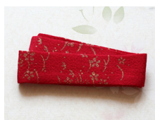
帯揚げ緋色に金彩MSDサイ スmac-0002