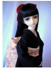
だらし帯 流水に櫻SD、13SD、DD共通サイズob-0052