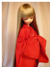
裾引き長襦袢 緋色 小振袖 n-0024