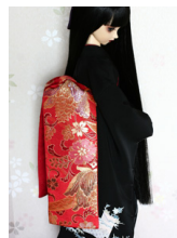
だらり帯紅唐草SD・13S D・DD共通サイズob-0169