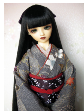
裾引き振袖櫻に金彩SD・13SD・DD共通サイズk-0154