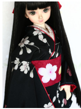
だらし帯桜花MSDサイズ mob-0044