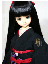
裾引き振袖黒地に奴さんMSD サイズmk-0060