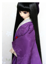
振袖用長襦袢若紫SDサイズ n-0078