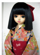
浴衣セット 紺地 菊柄 (単衣仕立て) 13SD、DDサイズk-0103