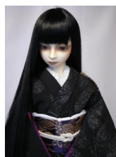
黒地に銀糸 裾引き小振袖と帯のセットs-0004