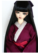
振袖用長襦袢葡萄色(ぶどういろ)16少女・13少年共通n-0066