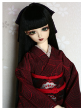
裾引き振袖黒地に水紋SD・ 13SD・DD共通サイズ k-0171