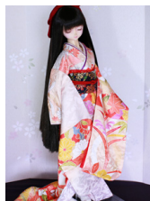
裾引き振袖八千代16少女・13少年共通k-0366