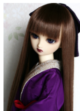
振袖用長襦袢紫SDサイズ n-0052