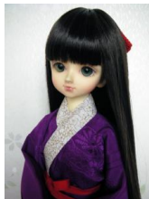
振袖用長襦袢紫MSDサイズmn-0002