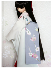
だらり帯梅SD・13SD・DD共通サイズ ob-0125