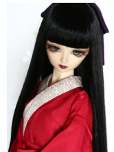
振袖用長襦袢紅色13SD・DD 共通n-0102