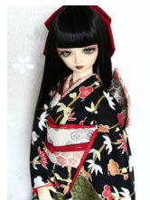
振袖梅霞SD・13SD・D D共通サイズk-0257