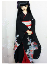
裾引き振袖牡丹と楓 16少女・ 13少年共通サイズk-0321