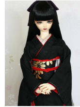
裾引き振袖黒無地 流水16少女・13少年共通k-0393