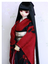
裾引き振袖闇の櫻SD・13 SD・DD共通サイズk-0350