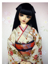
裾引き振袖流水に華SD・13SD・DD共通サイズk-0156