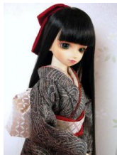
裾引き振袖黒地に波（八掛 黒）SD、13SD、DDサ イズk-0074