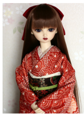
裾引き振袖朱色 総絞り 16少女・13少年共通サイズ k-0173