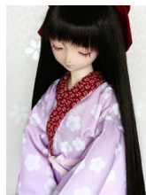
小振袖用長襦袢白梅13SD・DD共通n-0089