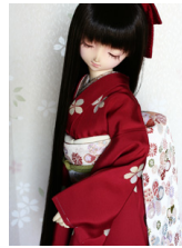
だらし帯ねじ梅SD・13SD D・DD共通サイズob-0161