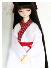
小振袖用長襦袢紅葉13SD・ DD共通サイズn-0077