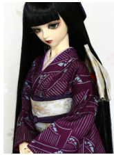
立て矢銀霞SD・13SD・ DD共通サイズob-0186