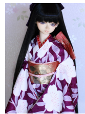
小振袖若紫にしだれ桜SD・13SD・DD共通k-0380