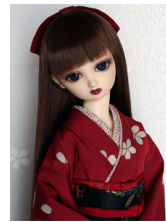
裾引き振袖茜SD・13SD・ DD共通サイズk-0184