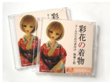
彩花の着物 ドールの着付け DVDs-0001