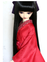
小振袖用長襦袢緋色SDサイ ズn-0080