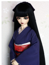
裾引き振袖色無地 鳩羽紫(は とばむらさき)SD・13SD D・DD共通サイズk-0167