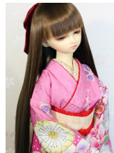
裾引き振袖辻ヶ花SD・13SD・DD共通サイズk-0334