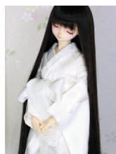
白長襦袢(帯付き)お寝間着用13SD・DD共通n-0075