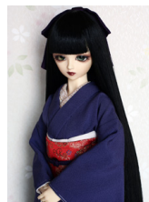
裾引き振袖色無地 鳩羽紫(はとむらさき)16少女・13少年共通サイズk-0168