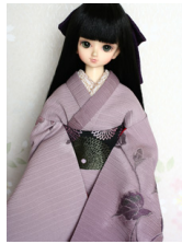
裾引き振袖藤のぼかしMSD サイズmk-0025