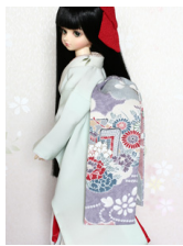
だらり帯辻が花MSDサイズ mob-0031