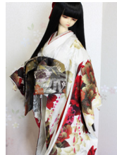
打掛セット葛城 (かつらぎ) 16少女・13少年共通サイ ズk-0309