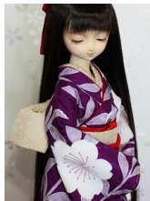
お文庫花立涌SD・13SD・DD共通サイズob-0185