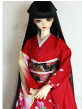
裾引き振袖桜手鞠16少女・13少年共通k-0391