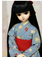
浴衣と帯のセット小花MS D サイズmk-0059