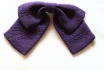
リボン 紫 Lサイズ ac-0013