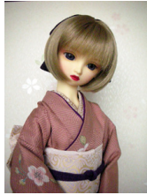
裾引き振袖櫻 灰桃色SDサイズk-0086