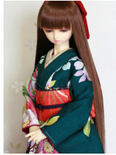
裾引き振袖深緑（ふかみどり） SD・13SD・DD共通k-0408