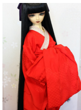
裾引き長襦袢と前帯のセット 緋色16少女・13少年共 通サイズn-0096