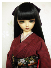
裾引き振袖臙脂に黒縞SD・13SD・DD共通サイズk-0147