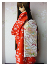
だらり帯蝶々SD、13SD、DD共通サイズ ob-0081