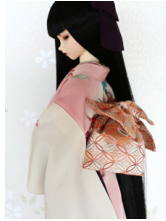
お文庫七宝SD・13SD・ DD共通サイズob-0135