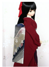
だらり帯雅(みやび)MSDサイズ mob-0024