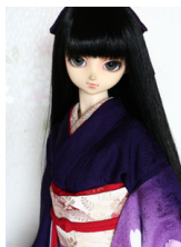
裾引き振袖紫ぼかしに八重桜 SD・13SD・DD共通サ イズk-0264