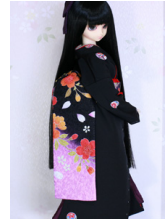
だらり帯朱桜SD~16SD・ DD共通ob-0224