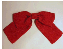
リボン 赤 Mサイズ ac-0043