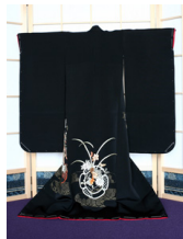
衣桁 (いこう) 木製ck-0001