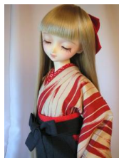
女袴 濃紺13SDサイズ j-0016