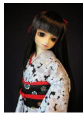
だらし帯 黒地五つ木瓜(いっつもっこう)SD、13SD、DD共通サイズob-0047