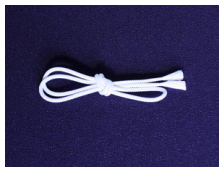
帯締め (組紐) 白ac-0076