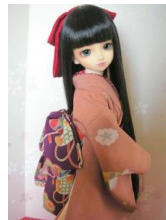
小振袖 犬張子13SDサイズk-0079