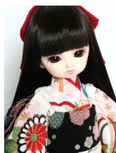
お着物セット薄桃色のぼかし 幼SDサイズyk-0003