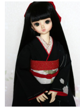
裾引き振袖櫻MS Dサイズ mk-0034