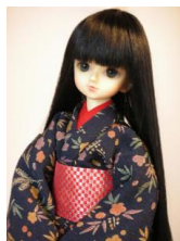
お文庫 赤と銀の市松MSD サイズmob-0020