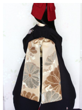
だらり帯大菊SD・13SD・ DD共通サイズob-0166