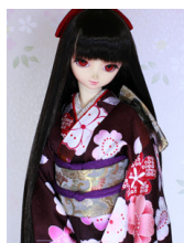
裾引き振袖桜花SD・13SD・ DD共通k-0352