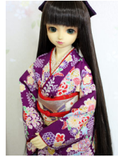
裾引き振袖藤姫SD・13SD D・DD共通サイズk-0346