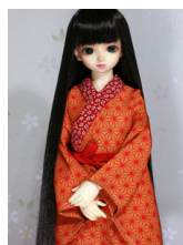
小振袖用長襦袢麻の葉 蜜柑色13SD・DD共通n-0110