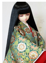
袷と単若菜(わかな) SD・13SD・DD共通j-0113