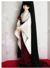
長袴濃色(こきいろ) SD・13SD・DD共通j-0102