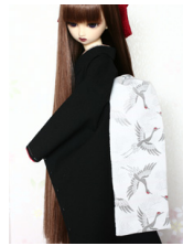
だらり帯白地に鶴SD・13SD・DD共通サイズ ob-0110