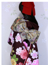
立て矢花唐草 利休鼠SD・13SD・DD共通ob-0219