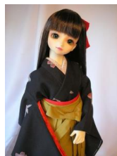
女袴と小振袖のセット13SD、 D、DD共通サイズs-0005