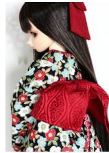
お文庫赤の立湧SD・13SD D・DD共通サイズob-0036R