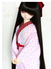
小振袖用長襦袢小桜13SD・DD共通n-0073