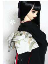
お文庫白地に鶴SD・13S D・DD共通サイズob-0132