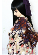
立て矢紺地に枝梅SD・13SD・DD共通サイズ ob-0176