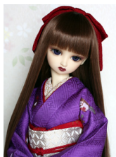
裾引き振袖京紫SD・13SD・DD共通サイズk-0181