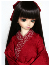
小振袖用長襦袢紅色13SD・ DD共通n-0091