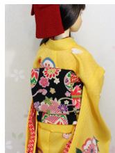
お太鼓黒地に手鞠と桜 SD~16SD・DD共通 ob-0211