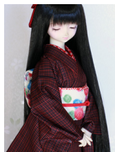
お太鼓鳥の子色に梅SD~ 16SD・DD共通ob-0234