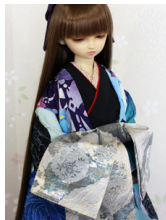
打ち掛け高尾(たかお)SD・ 13SD・DD共通サイズ k-0327