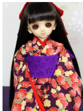
お着物セット紫地に梅幼SDサイズyk-0025