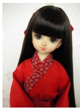
小振袖用長襦袢緋色MSDサ イズmn-0006