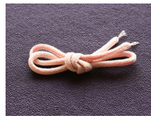
帯締め (丸くけ) 薄紅 ac-0061