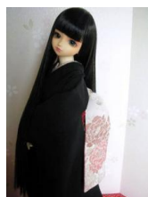
だらり帯 牡丹 ②SD、13SD、DD共通サイズ ob-0062