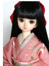
裾引き振袖朱華(はねず)に 金彩MS Dサイズmk-0032