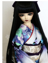
裾引き振袖八重桜SD・13SD D・DD共通サイ ズk-0285