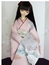
裾引き振袖牡丹SD・13SD D・DD共通サイズk-0311