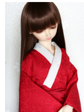
小振袖用長襦袢緋色SDサイ ズn-0082