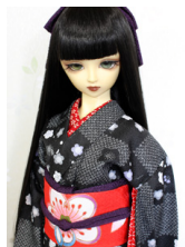
小振袖市松鹿の子SD・13SD・DD共通k-0340