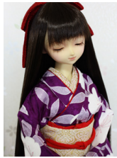
裾引き振袖若紫にしだれ桜 16少女・13少年共通サイズ k-0325