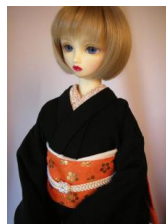
お文庫 梅に唐草SD、13SD共通サイズob-0009