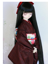
小振袖黒地に小さい格子SD・13SD・DD共通k-0371