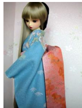
だらり帯 桃花色SD、13SD、DD共通サイズ ob-0059