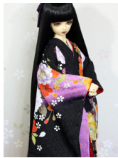
打ち掛け朱桜SD・13SD・ DD共通k-0337