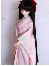
振袖用長襦袢桜（薄紅色）SD サイズn-0111