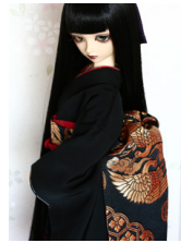
だらり帯黒地に向かい鶴SD・13SD・DD共通サイズob-0164