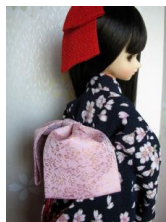
お文庫 桜色MSDサイズ mob-0003