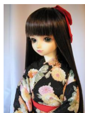
小振袖用長襦袢黒地に小菊D、13SD共通サイズgn-0006