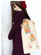
染めのだらし帯御所解き(ごしよどき)SD・13SD・DD共通サイズob-0140