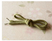
帯締め (丸くけ) 萌黄 もえぎ ac-0045