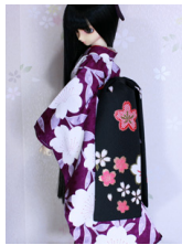
だらり帯黒地に緋桜SD~ 16SD・DD共通ob-0225