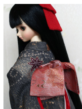
お文庫桃花色MSDサイズ mob-0012