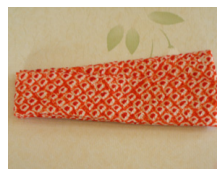
帯揚げ鹿の子 朱色 ac-0019