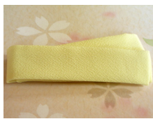
帯揚げ檸檬 (れもん) ac-0027