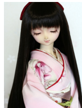
裾引き振袖躑躅(つつじ)S D・13SD・DD共通サイ ズk-0305