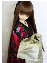
前帯 片流し流水SD・13SD・DD共通サイズob-0205