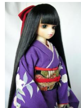
加賀友禅裾引き振袖と帯のセッ ト 百合SDサイズs-0010