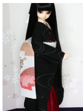
だらり帯朱華鹿の子(はねず かのこ)SD・13SD・D D共通サイズob-0177