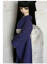
だらし帯氷櫻(ひおう)SD・ 13SD・DD共通サイズ ob-0098