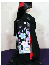
だらり帯黒地に桜MS Dサイズ mob-0056