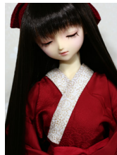
振袖用長襦袢濃紅16少女・13少年共通n-0084