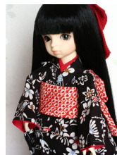
お着物セット黒地紅型風幼S Dサイズyk-0008