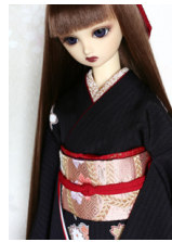
だらし帯束ね熨斗SD・13SD SD・DD共通サイズ ob-0145