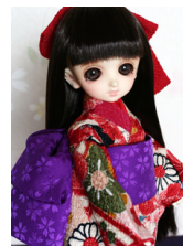
お着物セット牡丹幼SDサイ ズyk-0013