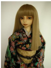
黒地紅型風 裾引き振袖 16 少女・13少年共通サイ ズk-0003