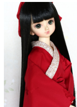
振袖用長襦袢紅色MSDサイズmn-0101