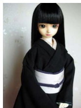
だらり帯 牡丹 ①SD、13SD、DD共通サイズ ob-0061