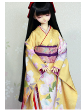
裾引き振袖花桜16少女・13少年共通k-0399