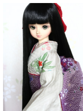
裾引き振袖芝草MSDサイズ mk-0040