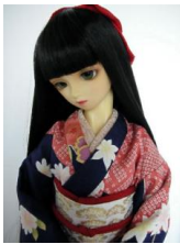
裾引き振袖紺地に染め匹田 (ひった) 16少女・13少年 共通サイズk-0016