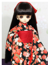
お着物セット黒地に梅幼SD サイズyk-0024