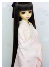
振袖用長襦袢薄桃SDサイズ n-0106