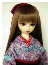
小振袖と帯のセット紫苑13SD・DD共通サイズk-0136