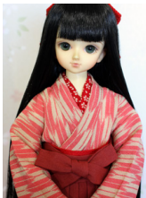
女袴と小振袖のセット桃色の 矢紺と臙脂の袴MSDサイズ mk-0068