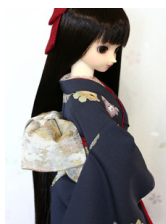
お文庫銀霞SD・13SD・ DD共通サイズob-0185