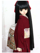
だらし帯短冊MSDサイズmob-0042