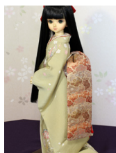
だらり帯梅重ねMSDサイズmob-0064