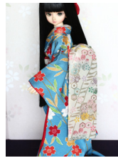
だらり帯桜の香MS Dサイズ mob-0050