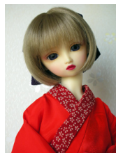
紬用長襦袢緋色13SD、D D共通サイズ