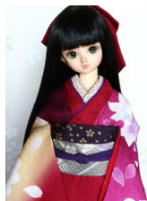
裾引き振袖宵の桜MSDサイズmk-0042