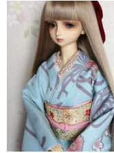
裾引き振袖大菊SD・13SD D・DD共通サイズk-0199