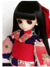
お着物セット華むらさき幼SD サイズyk-0011