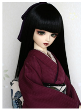
裾引き振袖洋蘭SD・13SD D・DD共通サイズk-0132