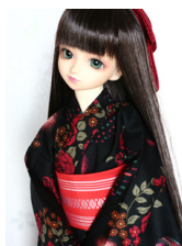
浴衣セット 薔薇 黒 (単衣仕立て) SD・13SD・DD共通サイズk-0225