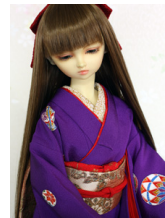
裾引き振袖紫に手鞠16少女・13少年共通k-0362