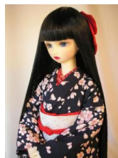
小振袖櫻吹雪 紺地 13SD、DD共通サイズk-0048