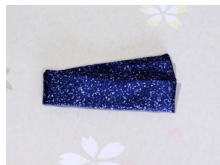
帯揚げ藍色にあらねac-0068