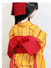
お文庫紅無地SD~16SD・ DD共通ob-0249