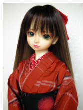
紬のセット格子紬 赤SDサ イズ