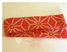
帯揚げ麻の葉(あさのは) ac-0030