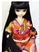
裾引き振袖朱桜16少女・13少年共通サイズk-0336