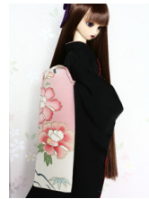
だらり帯牡丹SD・13SD・ DD共通サイズob-0133