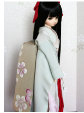
だらり帯梅MSDサイズ mob-0032