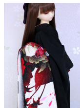
だらし帯紅薔薇2SD・13SD・DD共通ob-0218