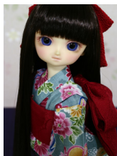
浴衣と帯のセット手鞠 水縹 幼S Dサイズyk-0020