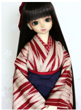
女袴と小振袖のセット赤い矢 紺と紺の袴SDサイズ k-0295a