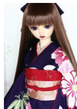
裾引き振袖八重桜 紫SD・13SD・DD共通サイズk-0239