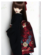
だらし帯玉虫SD、13SD、 DD共通サイズob-0088