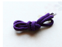
帯締め (丸くけ) 堇 (すみれ) ac-0060