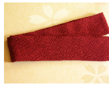
帯揚げ臙脂 (えんじ) ac-0028